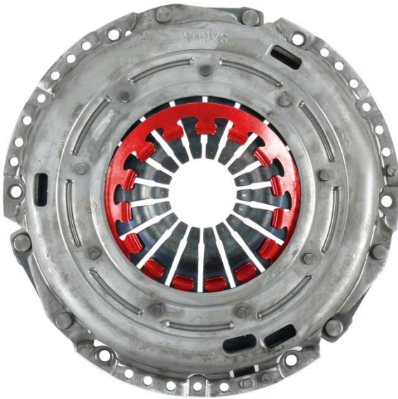
Sl. 4: Dodatna opruga pomerena

Više informacija za servis naći ćete ovde: www.zf.com/serviceinformation