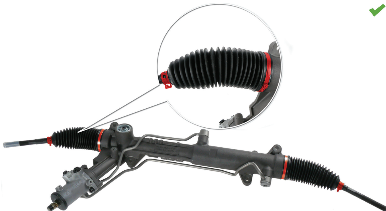
Fig. 1: Prenosni mehanizam volana sa ispravno montiranim manžetama