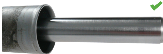
Fig. 2: Zupčasta letva bez korozije