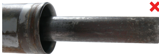
Fig. 3: Zupčasta letva sa korozijom