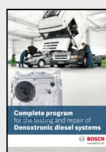
Brošura (8 ili 32 str.)